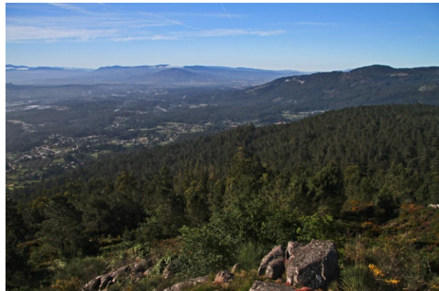
Vista cara ao monte Aloia e o val do Louro, coas serras de Portugal ao fondo