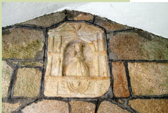
Capela da Virxe das Neves