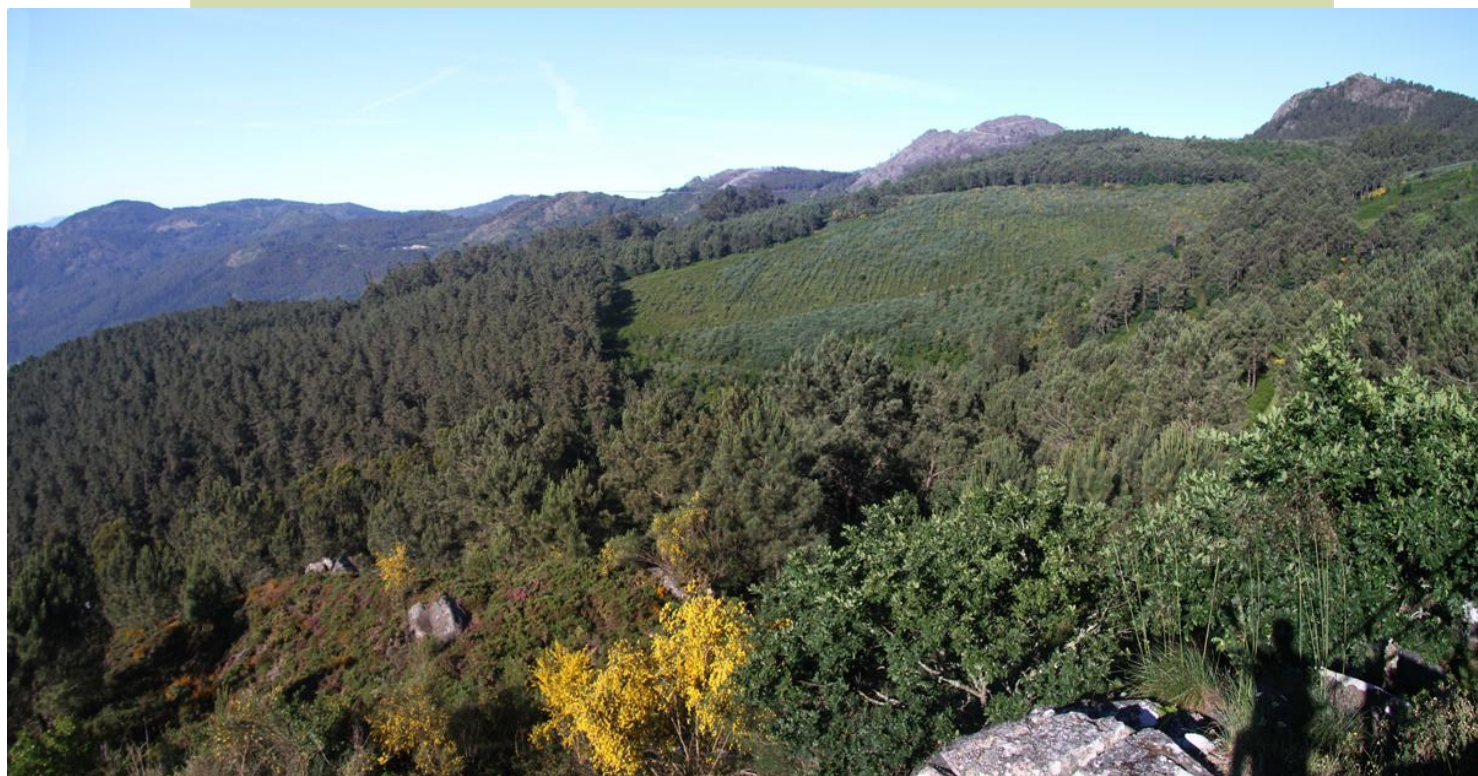
Vista da cara leste da serra do Galiñeiro co monte Aloia ao fondo á esquerda