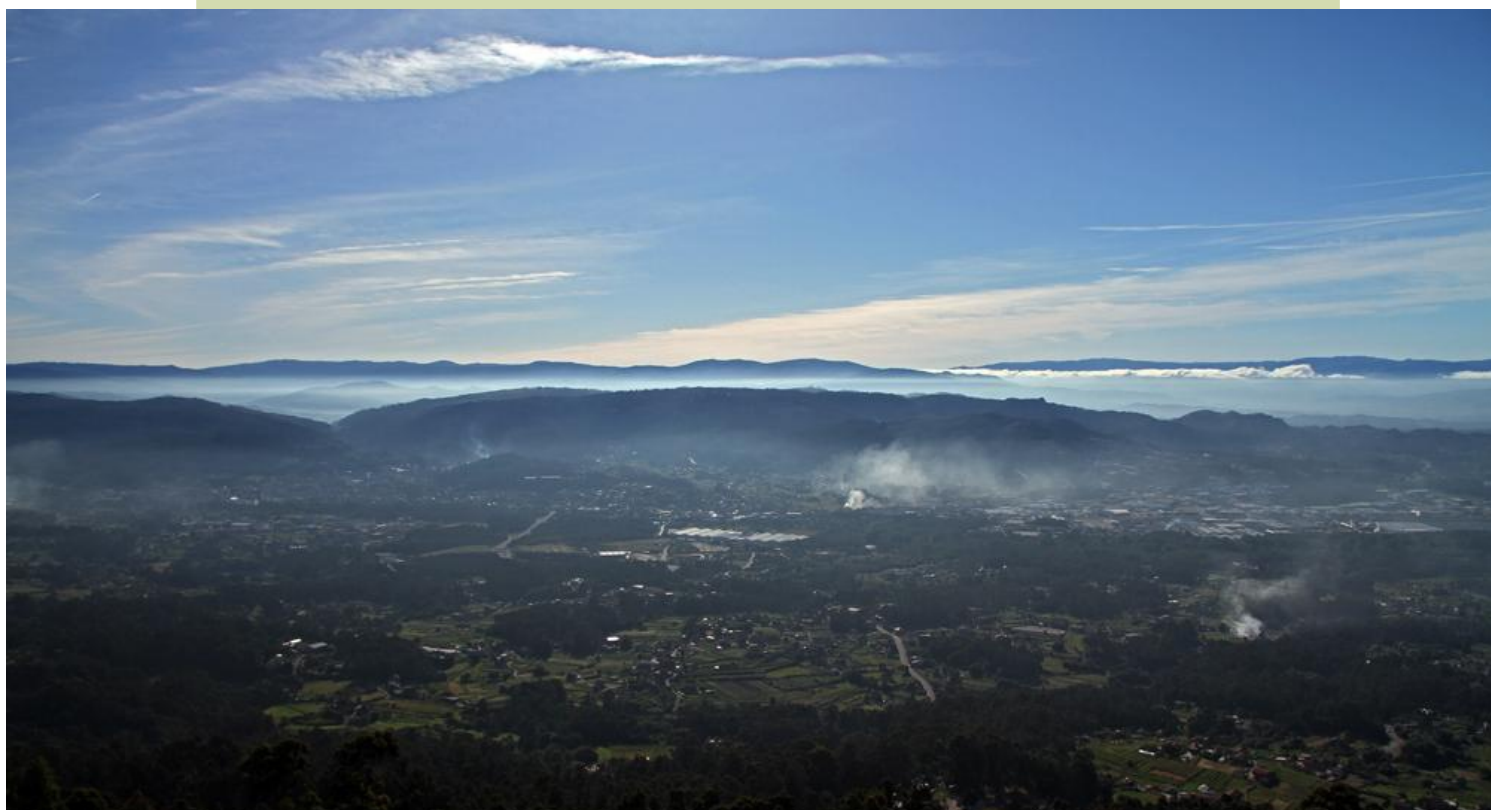
Vista pola mañán cara á depresión de Porriño, cos montes de Budiño e as serras da Dorsal Galega e Portugal ao fondo