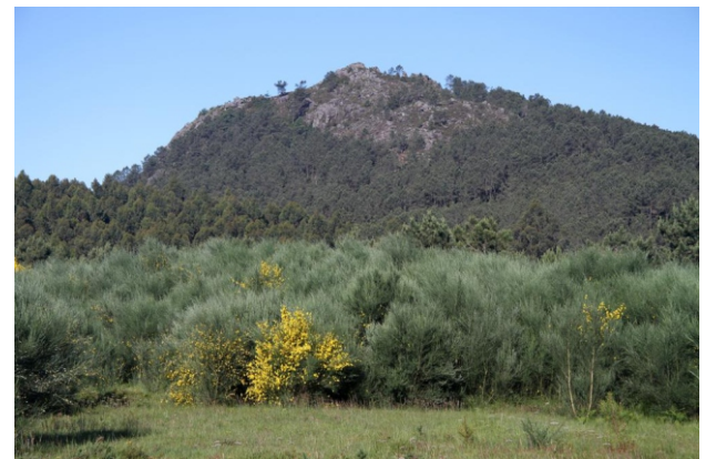
Alto da Fonte do Pobo (654 m)