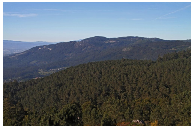
Vista cara ao monte Aloia